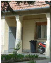
Vén József u. 10. (410 hrsz)

Településképi a folyamatos átépítéseket mutatja, az elmúlt száz évben épült házak váltakozva jelennek meg. Szórványosan egy-egy népi építészeti értéket képviselő lakóház még fellelhető. Némelyik eredeti állapotában fennmaradt, ezek helyi védelemre érdemesek. Védelemre érdemesek még az átépített épületek eredeti elmei is. Gyakran látni példát arra, hogy az ablakokat kicserélték vagy a tornácot befalazták, de az oromfalakat megőrizték.