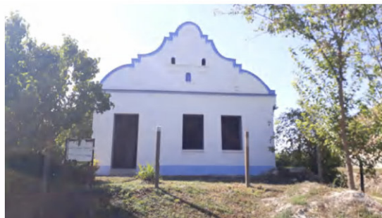
Az épület főhomlokzata 2020-ban és 2021-ben.