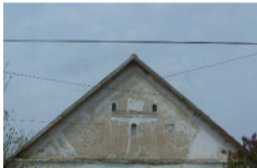
Vén József u. 40. (378 hrsz)