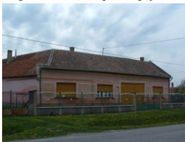
Kossuth u. 29. (417 hrsz)

Polgári karakterű településképi jelentőségű épületekre is van példa