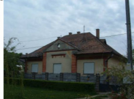
Kossuth u. 23. (420/1 hrsz)

Ipartörténeti jelentőségű a Kossuth Lajos u. 85 (375 hrsz) alatti malom