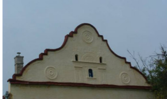
Mező u. 1. (223 hrsz)