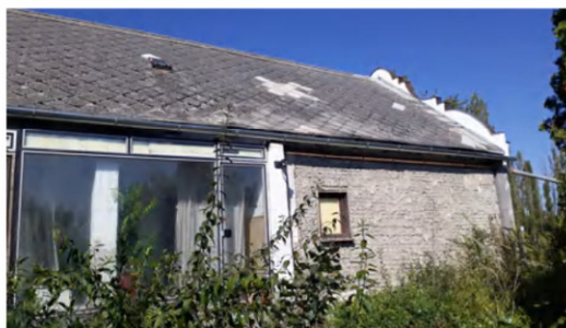
Az épület udvari homlokzata.